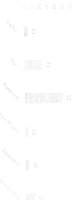
Показатели теста в %

По результатам исследования обучающихся, самые высокие показатели имеют учащиеся из старшей возрастной группы 9-11 классы 90%, далее младшая возрастная группа 1-4 класс 56% и средняя возрастная группа 5-8 класс 47%.